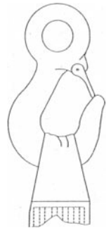
Bild D.1 - Darstellung einer unsachgemäßen Anpassung eines Schlaufengurtbandes an einen Haken mit zu kleinem Radius

ANMERKUNG Zur Vereinfachung der Darstellung ist die Schlaufenverstärkung weggelassen worden.